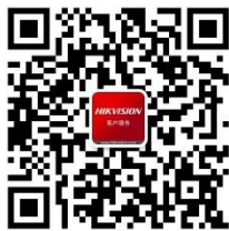
海康威视客户服务

海康威视秉承“专业、厚实、诚信”的经营理念，践行“成就客户、价值为本、诚信务实、追求卓越”的核心价值观，不断创新，不断发展多维感知、人工智能、与大数据技术，为人类的安全和发展开拓新视界。