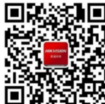
海康威视中小企业公众号