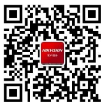
海康威视客户服务

海康威视在中国大陆设有 32 家省级业务中心,在港澳台地区及海外国家/地区设立了 66 家分支机构 (截至 2020 年 12 月 31 日)。其产品和解决方案应用在 155 个国家和地区,在 G20 杭州峰会、北京奥运会、上海世博会、APEC 会议、英国伦敦邱园、德国科隆东亚艺术博物馆、北京大兴机场、港珠澳大桥等重大项目中发挥了重要作用。